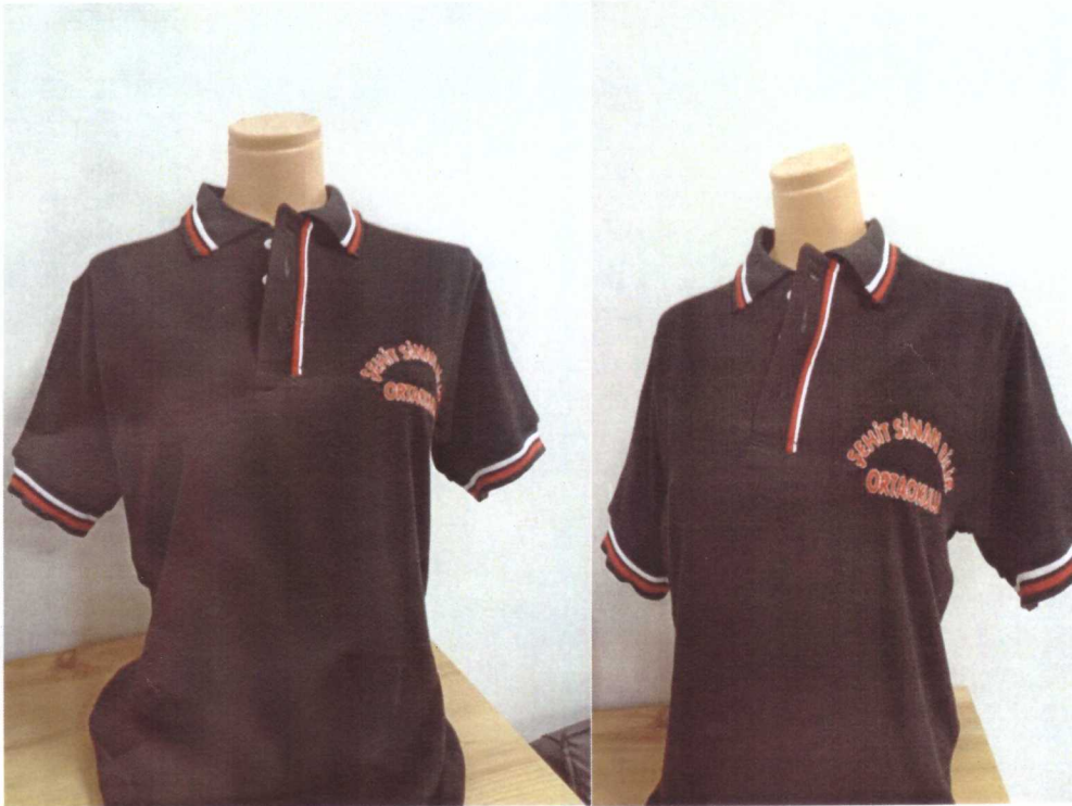
LAKOSTE T-SHIRT ÖN